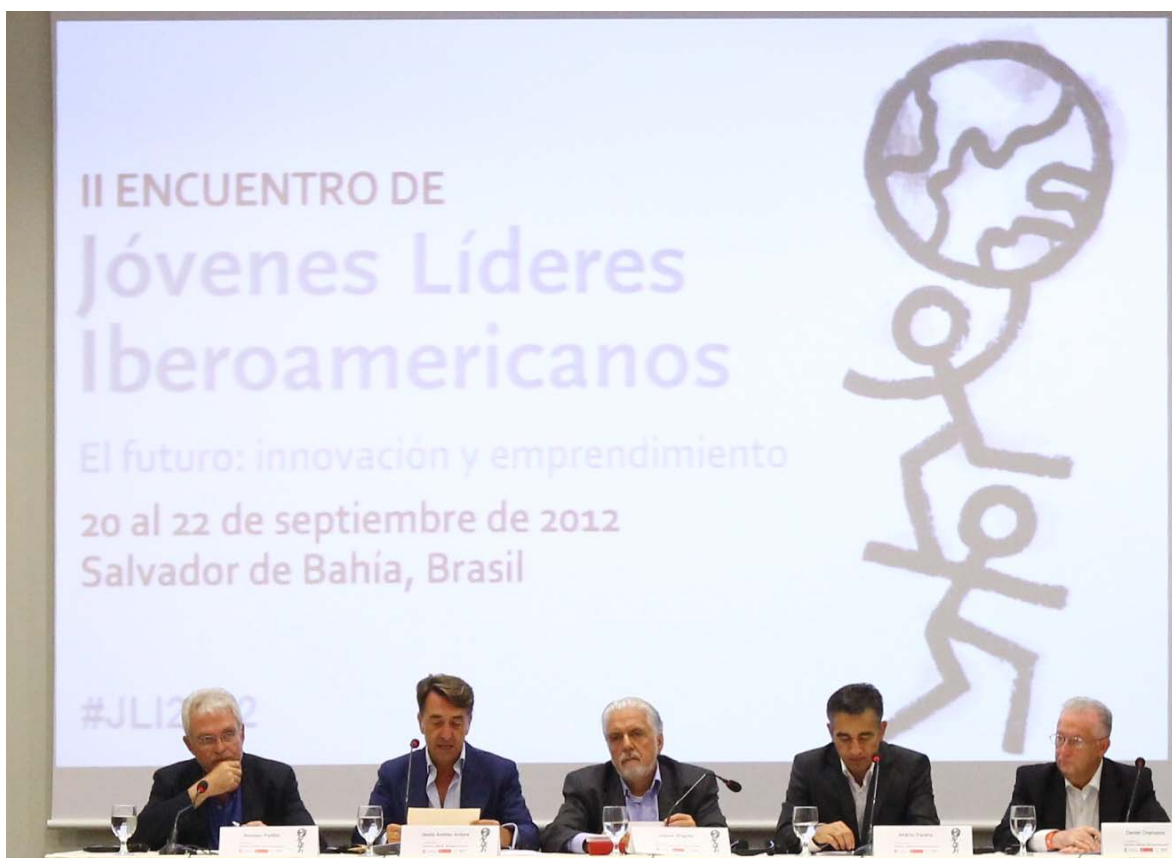
Acto de Inauguración

ideas, basada siempre en la negociación y en la búsqueda de consensos. En relación a la superación de los dogmas creo que hay que buscar un equilibrio entre la libertad de mercado y la necesidad de contar con Estados que provean de servicios sociales básicos. El desafío de la modernidad se afronta mejor con la colaboración entre las empresas y los gobiernos, como por cierto se está abordando la organización del Mundial de fútbol de Brasil para 2014. Reitero por último mis agradecimientos a las instituciones organizadoras. Muchas gracias, les deseo unas felices jornadas.