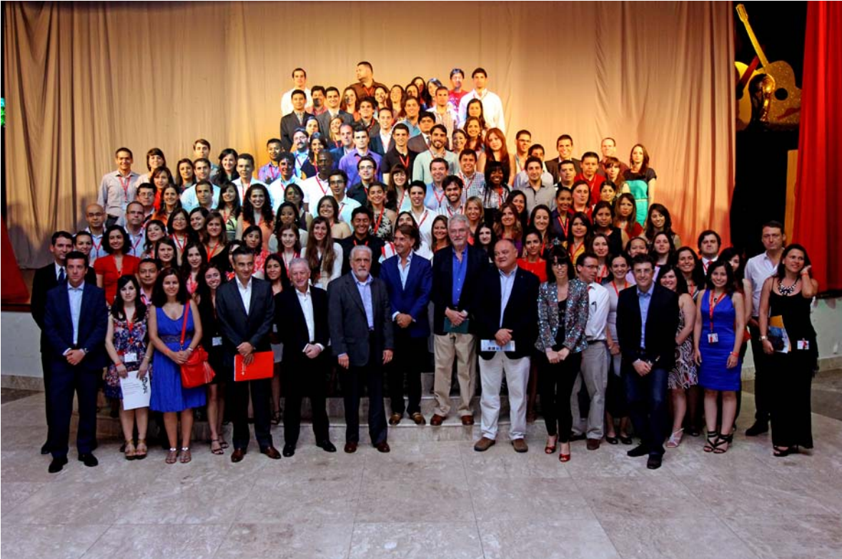
Foto de Familia