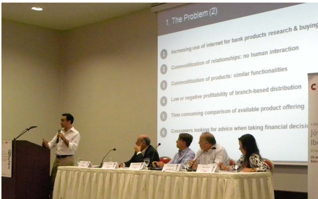
Ponencia 3. El futuro: innovación y emprendimiento

Buenos días. Me ha gustado mucho escuchar palabras como espontaneidad, felicidad, creatividad y libertad en todas las ponencias. Y escuchar que el activo más importante es el capital humano. Quisiera saber a través de las experiencias de todos nosotros cómo afectan las inversiones en las empresas mirando sobre todo a las personas que trabajan en las mismas. Es necesario un ambiente estimulante para que surjan la creatividad y la innovación. En los momentos de crisis que vivimos debemos esforzarnos más en pensar cómo ser innovadores en la práctica. Y pensar en hacer inversiones no solo de recursos sino también con nuestro tiempo, porque a menudo parece que no tenemos tiempo para nada. En relación a la innovación es asimismo muy importante no solo el producto final sino que quizá lo más importante es el camino que uno hace en una dirección nueva. Esto es lo que realmente nos hace progresar. Muchas gracias.