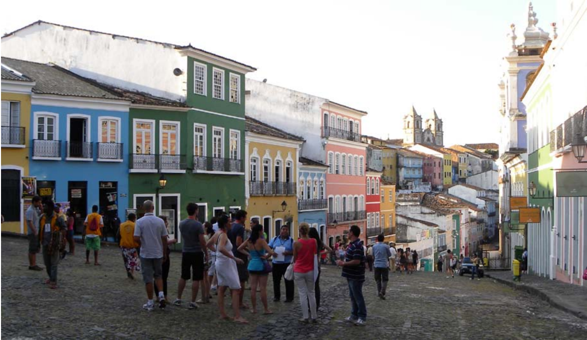
Visita cultural. Salvador de Bahía