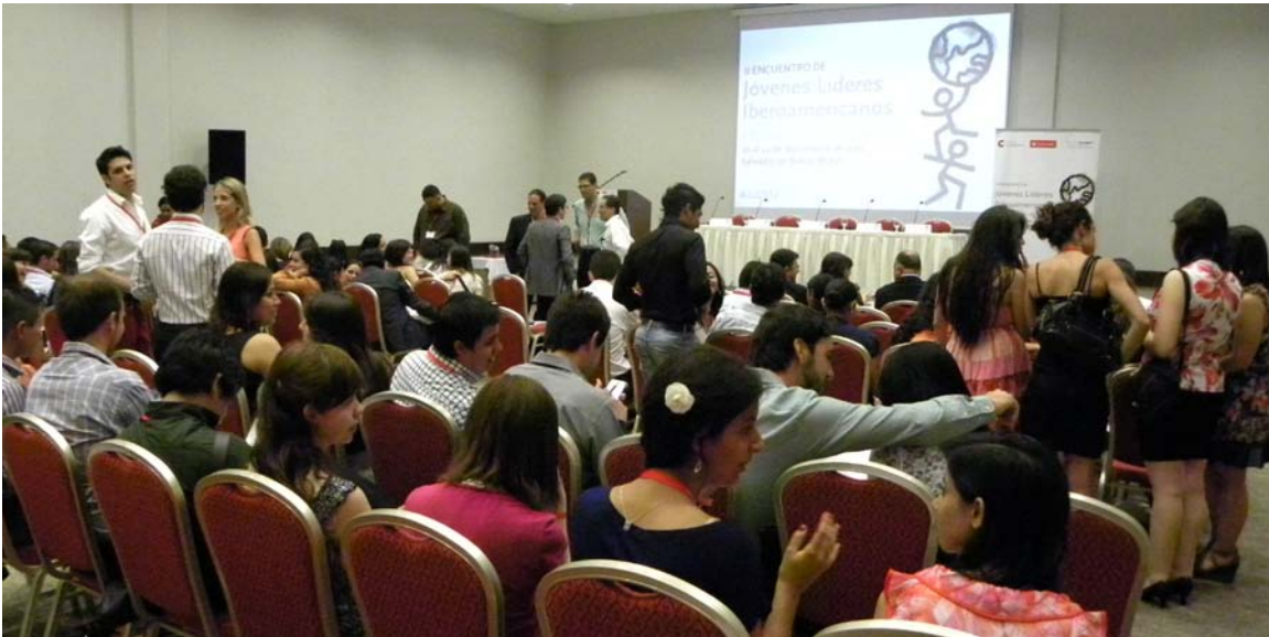
Ponencia 1. Debate

seguir gobernando eternamente. Sin política no hay democracia. Ha sido una sesión muy útil. Muchas gracias.