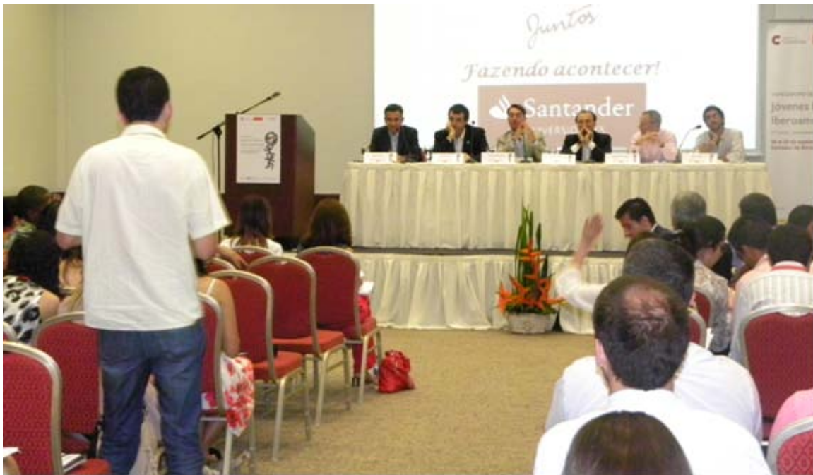
Ponencia 4. Debate

Trabajar en pos de conocernos mejor me parece la premisa básica para construir entre todos una Iberoamérica más unida. Pensaba en este sentido que, como apuesta de integración, hay que pasar, y nosotros también como jóvenes líderes, pasar del singular al plural. Y así, cuando formulemos preguntas, en vez de empezar diciendo: “en mi país...”, empezemos diciendo: “en nuestros países...”. De esta forma podremos pensar ideas comunes para todos y para construir ese futuro que nos merecemos, conociéndonos mejor. Muchas gracias.