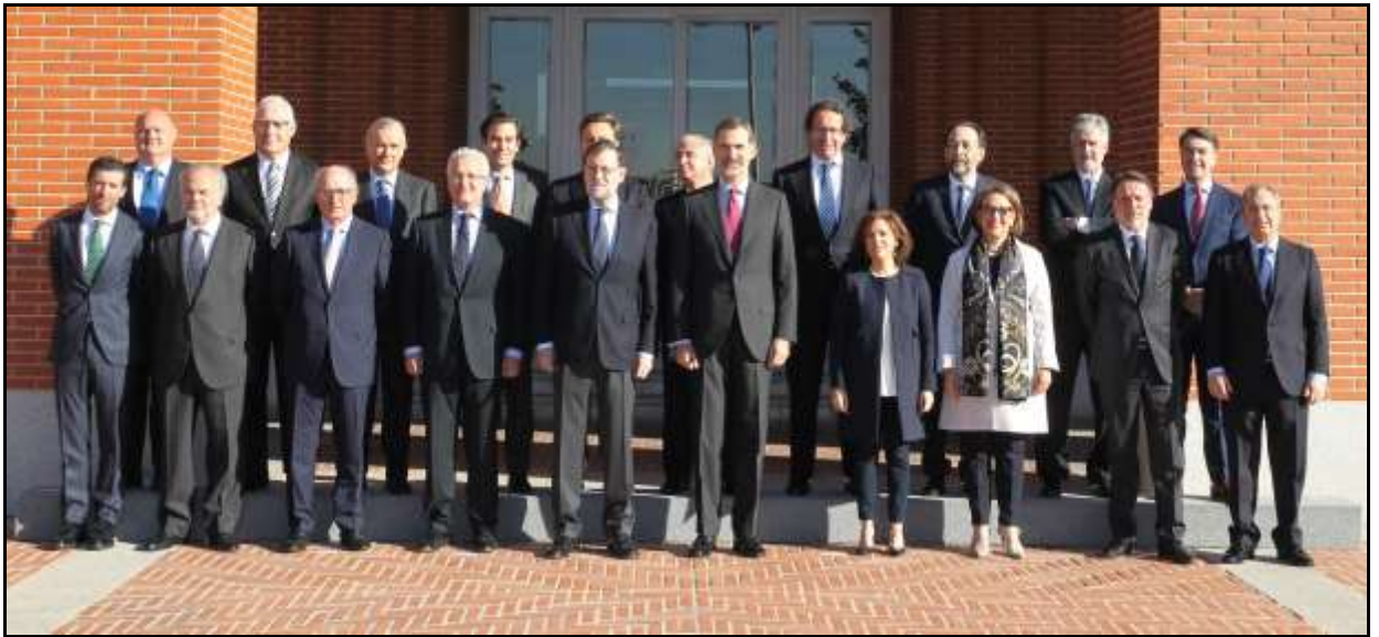
XXVIII sesión ordinaria del Patronato de la Fundación Carolina Palacio de la Zarzuela - 16 de marzo de 2017