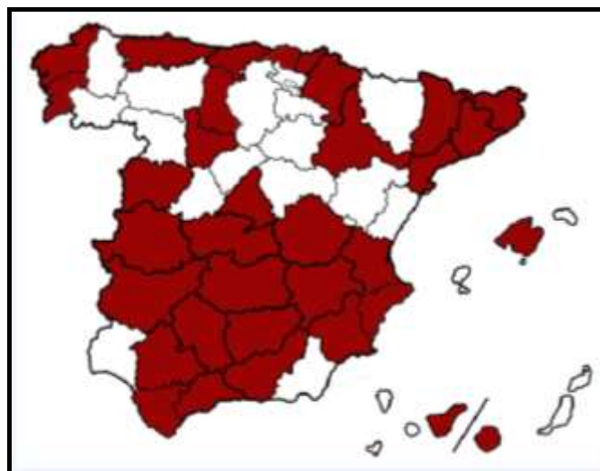
Distribución de los becarios por provincias