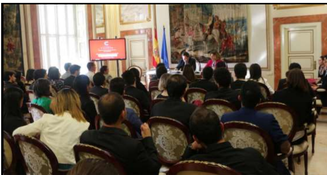
Jornada de Bienvenida a becarios de la FC - 27 de septiembre de 2017 Centro de Estudios Políticos y Constitucionales