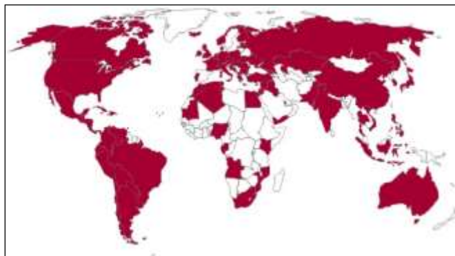
Ámbito de acción del PIV

El Programa Internacional de Visitantes está dirigido a personas relevantes y con proyección de futuro en sus respectivos países, a quienes se ofrece visitar España para que entren en contacto con responsables de su mismo campo profesional, además de poder conocer la realidad actual española. La aprobación y el diseño de las visitas se realizan en concordancia con las prioridades de la acción exterior. Está abierto a personas de todos los países del mundo, con especial atención a los candidatos provenientes de Iberoamérica y, de forma adicional, a aquellos procedentes de otras áreas prioritarias en la política exterior española.