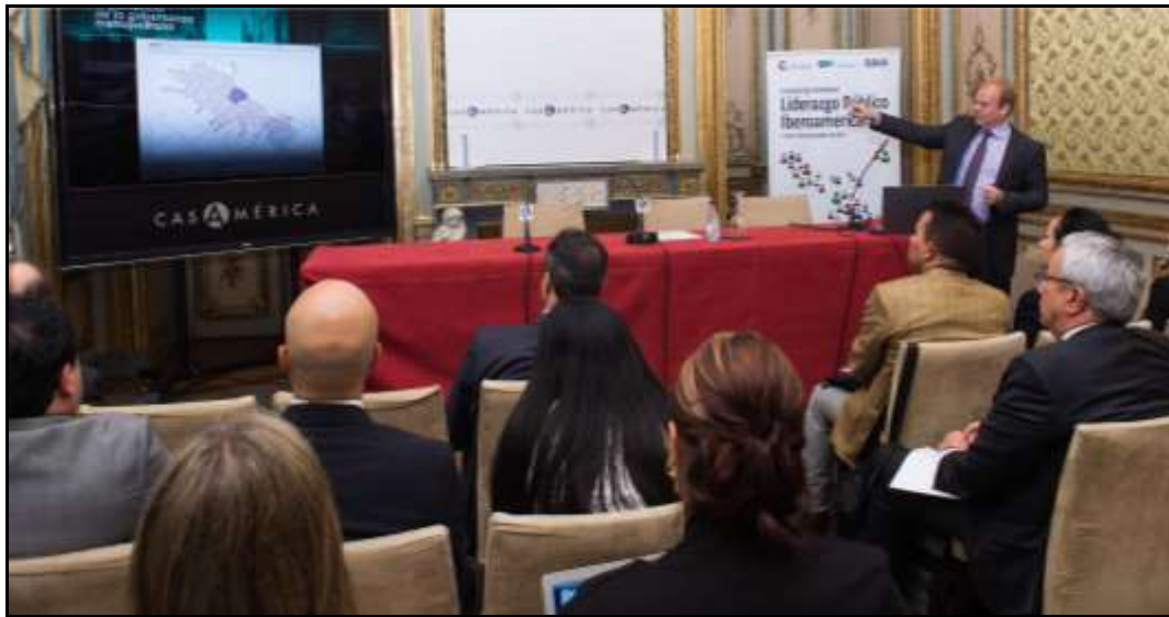
II Edición - Programa de Liderazgo Público Iberoamericano