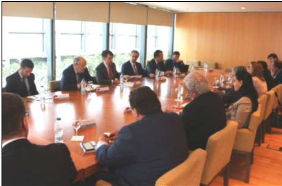
XXI Sesión del Círculo Carolina